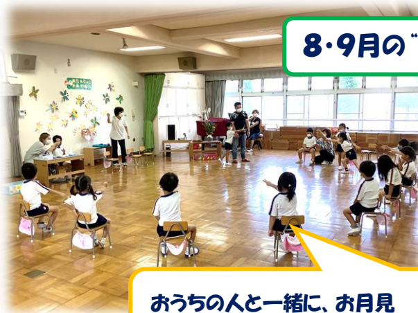
8・9月の“合体”誕生会