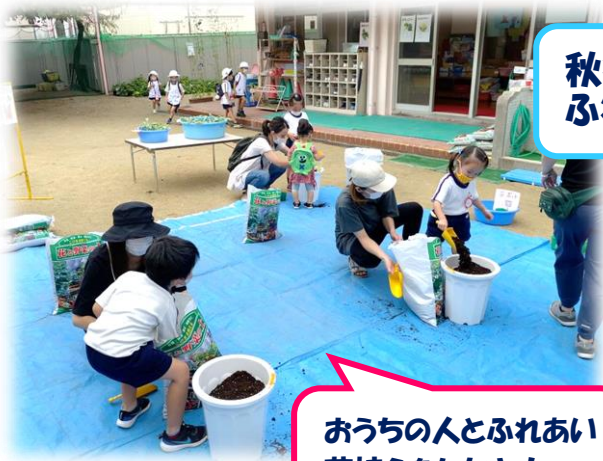
秋冬 ふれあい苗植え